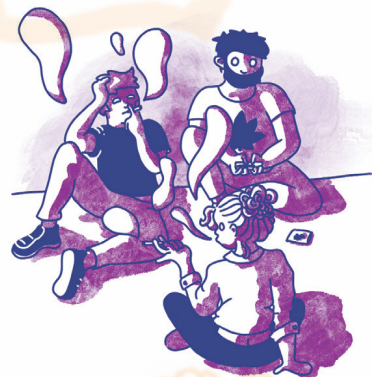
infographie : S. Gagnebin